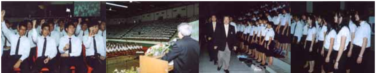
ยินดีต้อนรับนักศึกษาใหม่ ประจำปีการศึกษา ๒๕๕๐