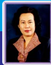
ศ.ดร.คุณหญิงสุริยา จิตนกุล วิทยาลัยศาสนศึกษา