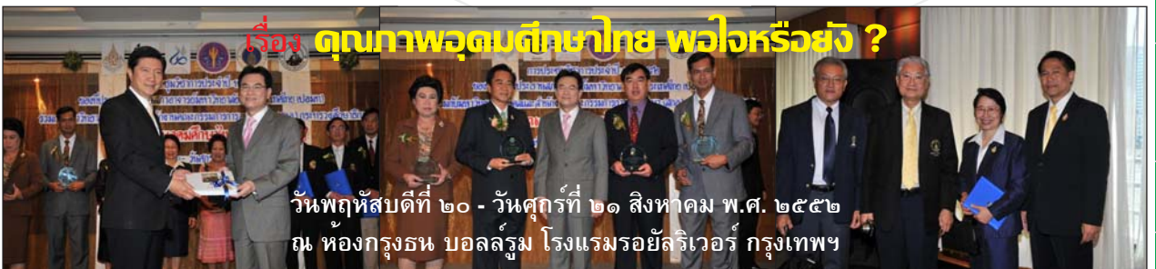
วันพฤหัสบดีที่ ๒๐ - วันศุกร์ที่ ๒๑ สิงหาคม พ.ศ. ๒๕๕๒ ณ ห้องกรุงธน บอลรูม โรงแรมรอยัลริเวอร์ กรุงเทพฯ