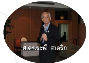
ศ.ดร.ระพี สาคริก