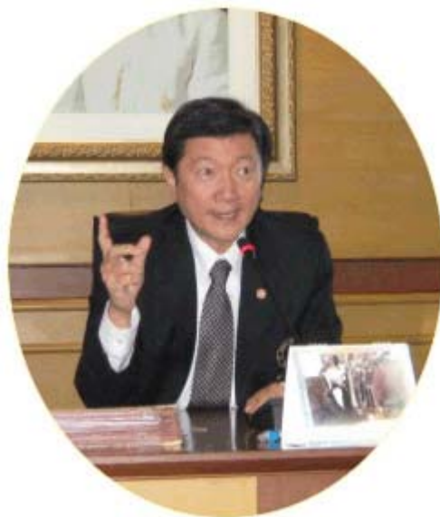
ศ.คลินิก นพ. ปิยะสกล สกลสัตยาทร อธิการบดี

คนโปรดของตัวเอง (อันนี้ปกติก็ทำอยู่แล้ว) หรือข่าวหน่วยงาน ค. กลุ่มผู้บริหารรวมตัวหาผลประโยชน์ เอื้อผลประโยชน์ในกลุ่ม ใช้อำนาจกลั่นแกล้งลูกน้อง ลูกน้องพูดไม่ได้ (จะพูดได้อย่างไร สุภาพตสอนให้รักษาตัวรอดเป็นยอดดี) หรือหน่วยงาน ง. ผู้บริหาร